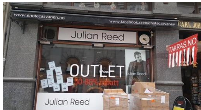
Outlet i Svaneapotekets lokaler i Oslo.

Etter at Enoteca Svanen avsluttet sin virksomhet i de flotte lokalene til Svaneapoteket har andre inntatt dem. En kleskjede ved navn Julian Reed etablerte et «outlet» med liten respekt for historien og bruken av interiøret. Byantikvaren svarte på vår henvendelse at dette bare var et midlertidig tiltak, og: «Her skal det bli noe annet som ivaretar de fredet interiørene. Byantikvaren styrer ikke bruken av bygningene. Men vi passer på interiørene».