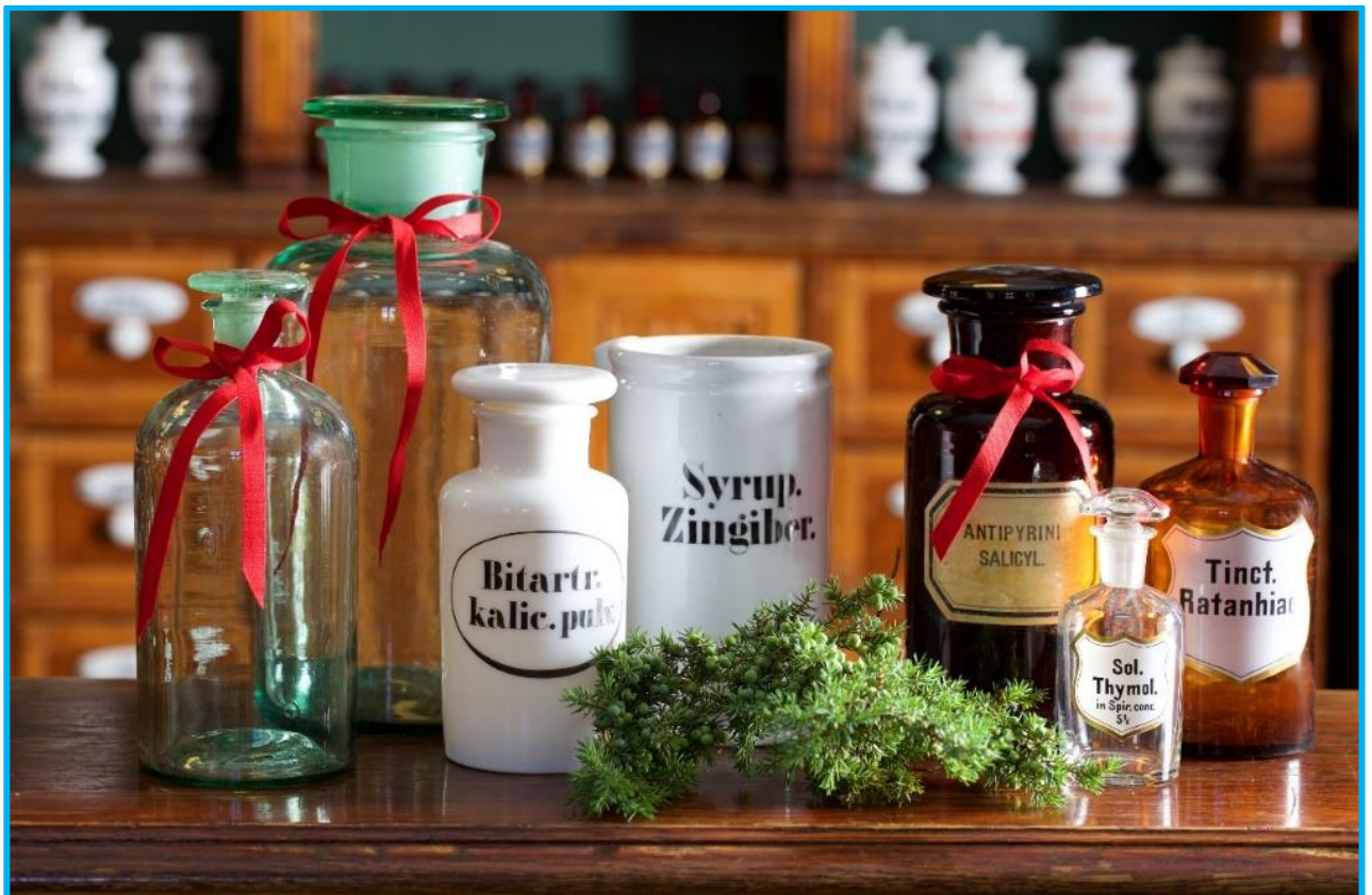
Jul i apoteket på Farmasihistorisk Museum, Bygdøy.

Hilsen Styret i Norsk Farmasihistorisk Selskap