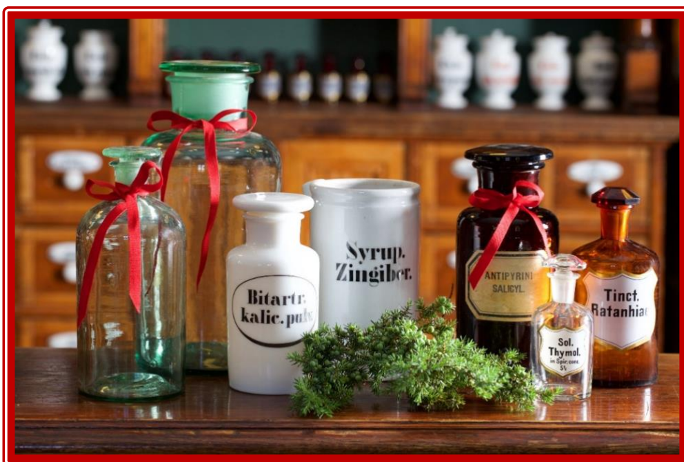
Jul i apoteket på Farmasihistorisk Museum, Bygdøy.